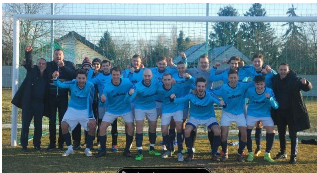
(Pásztó SK 1-2 Berkenye SE) (2021.02.27.)

A tavaszi rajt idén viszonylag korán érkezett és egy nem akármilyen párharcra indult a pontvadászat második felvonása. A csapat Pásztóra volt hivatalos az első körben, ahol mindig nehéz meccsre számíthat minden látogató. Bár a pásztói szurkolók a zártkapus szabály miatt nem buzdíthatták csapatukat a lelátóról, mégis pikáns ütközetnek